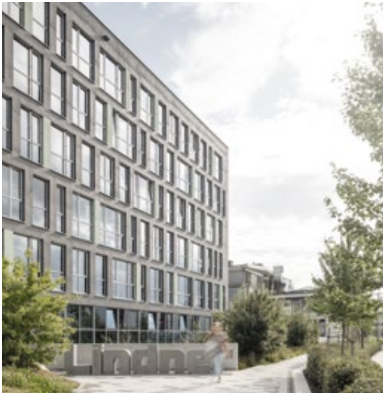
Hauptsitz der Lindner Group in Arnstorf, Bayern